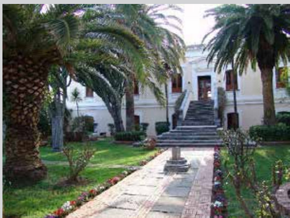
PALAZZO DEI GIACOBINI